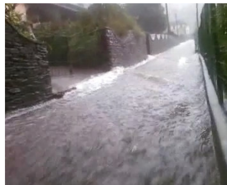
Impressionante la quantità d'acqua scaricata in una notte a Ornavasso e Migiandone