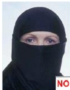
figura 12 bis