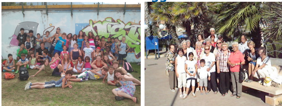
Le foto accomunano i nostri ragazzi ed i pensionati al mare: estate attiva a tutte le età