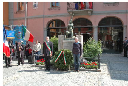
due momenti della partecipata celebrazione del 25 Aprile a Migiandone e Ornavasso