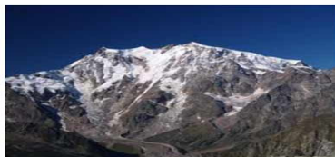
Monte Rosa - La Parete Est

MUSICHE ED IMMAGINI "DALLA VAL D'OSSOLA ALLA BISALTA...." NEL 150° DELL'UNITA' D'ITALIA