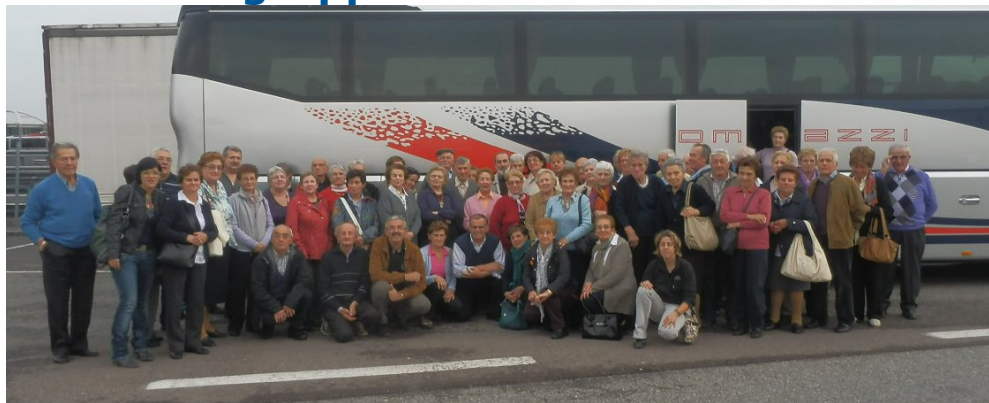
Foto di gruppo alla Gita dei Pensionati