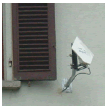
Particolare dell'antenna della stazione ricevente presso il Municipio di Ornavasso, che raccoglie segnale e registrazioni. Gli sviluppi futuri del Wi-fi saranno oggetto di approfondimento da parte del comune.