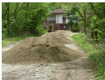
Nella foto: lavori su una strada di campagna.

I lavori non esauriscono tutte le necessità – segnalate anche dai cittadini – ma sono quelli consentiti dal finanziamento disponibile, pari a 40 mila euro e risalente ancora agli stanziamenti 2004 della giunta regionale, non essendo pervenute altre risorse negli anni successivi per tali interventi.