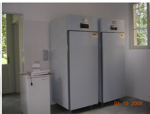
Nelle foto: la sala al pianterreno della Società Operaia e un particolare delle cucine