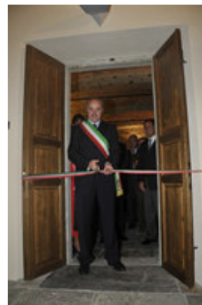
Autorità e molta gente all'inaugurazione dei lavori di ristrutturazione del piano terra del Palazzo Comunale. A lato il momento del taglio del nastro