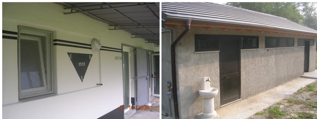
Nelle foto: l'esterno degli spogliatoi del campo sportivo di Ornavasso, appena ristrutturati e dei nuovi spogliatoi al campo sportivo di Migiandone

Nell'autunno riprendono tutte le attività sportive, i campionati di calcio, i campionati giovanili, i tornei C.S.I. e le attività scolastiche. Per questo nell'estate sono stati completati i lavori di rifacimento degli spogliatoi del campo sportivo di Ornavasso, con la sostituzione di tutta la parte impiantistica, dei sanitari,