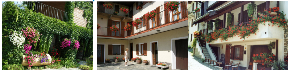
Nelle foto i primi tre balconi premiati

Record di adesioni per l'edizione 2009 del concorso comunale