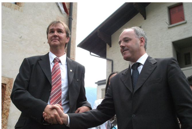
I due sindaci in occasione dell'incontro a Naters del 2005

Si preannuncia come il gemellaggio dei record lo storico appuntamento di domenica 6 giugno: saranno infatti un migliaio gli amici di Naters che raggiungeranno il nostro paese, per una tradizione che si ripete ogni cinque anni, alternativamente a Naters e ad Ornavasso. Una quindicina di vallesani partiranno a piedi da Naters nella giornata di giovedì, mentre autorità, cittadini e gruppi raggiungeranno Ornavasso con 16 pullman attesi in P.zza XXIV Maggio a partire dalle ore 9,00. Una ventina i gruppi folcloristici e musicali che da Piazza Bianchetti